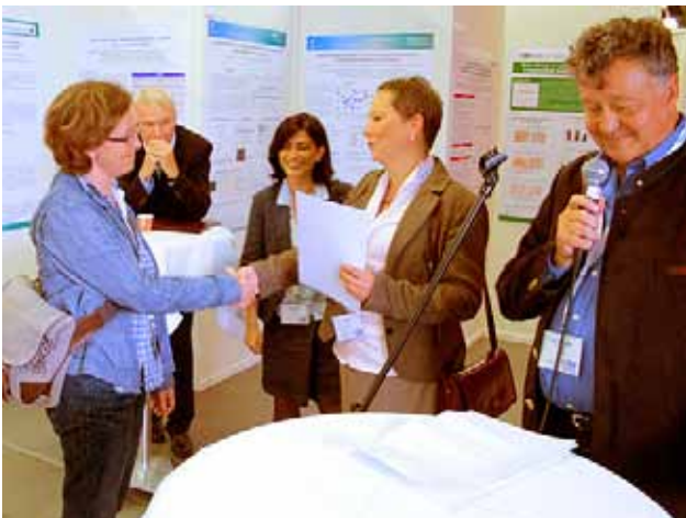
Die attraktive Posterausstellung, mit täglichen Preisverleihungen.