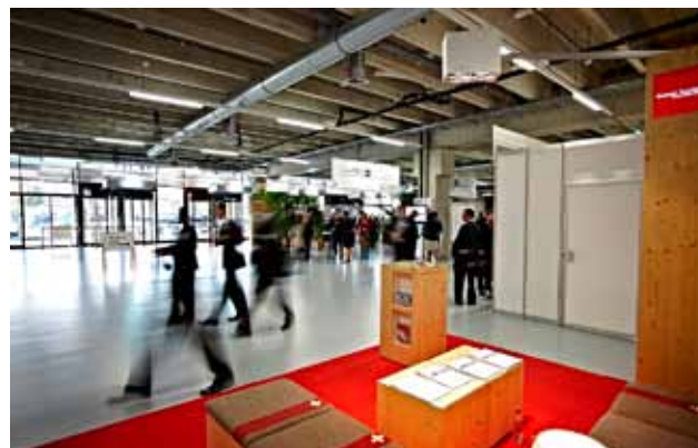
Mit rund 2000 m 2 ist die BERNEXPO-Halle 1 eine ideale Basis.

T +41 (0)21 964 20 13 F +41 (0)21 964 20 14 E-Mail helene.schupbach@event4you.net www.event4you.net