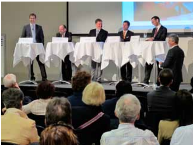
Auf politische und wirtschaftliche Aspekte der Labormedizin wird 2016 ein besonderer Fokus gelegt.