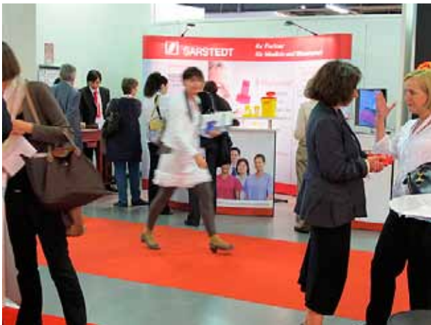
Die grosszügigen Platzverhältnisse der BERNEXPO bieten den Sponsoren eine perfekte Plattform.