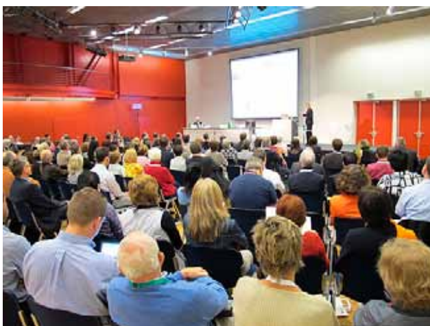
Die Vorträge finden in den direkt über der Ausstellung liegenden Konferenzsälen statt.

Swiss MedLab 2012 in Bern war ein Erfolg für Teilnehmer wie Aussteller. Wir freuen uns darauf, den Kongress im Jahre 2016 – wiederum in Bern – mit Ihnen zusammen zu einem vielversprechenden «get together» der Labormedizin zu führen. Der Diagnostikaindustrie steht in Bern eine ideale Infrastruktur zur Verfügung.