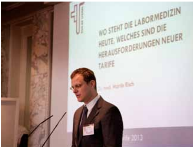
Die SULM betreibt Verbandsarbeit im Dienste der Schweizerischen Labormedizin.