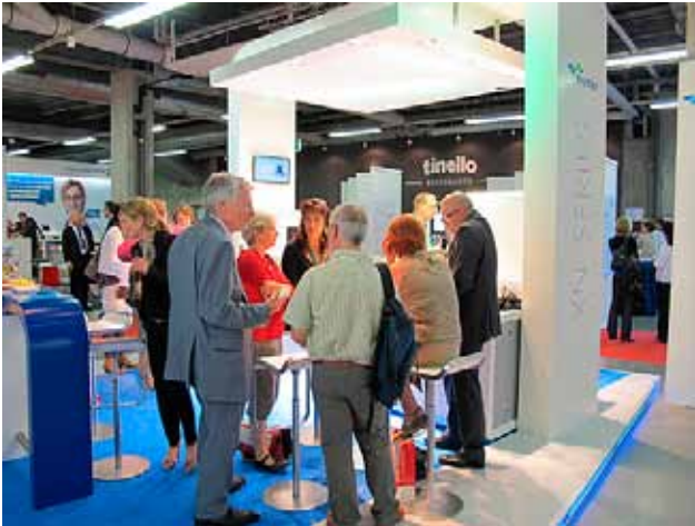
Die repräsentative Ausstellung, ein Gewinn für Teilnehmer und Besucher.