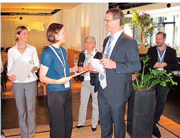
Die besten Vorträge werden prämiert, z.B. mit dem Swiss MedLab Award.

Die Schweizerische Union für Labormedizin SULM und die ihr angeschlossenen nationalen Fachgesellschaften führen den nächsten Swiss MedLab-Kongress vom 14. bis 16. Juni 2016 im BERNEXPO-Kongresszentrum in Bern durch.